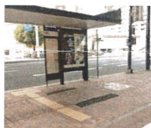
⑤西鉄三萩野バス停