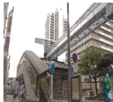
①モノレール香春口三萩野駅