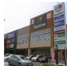
⑩ サンリブもりつね