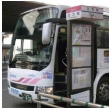
① 福岡行高速バス停