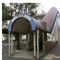
② モノレール北方駅