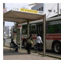
⑨ 北方・北九大バス停