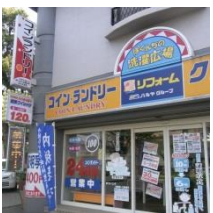
⑧ コインランドリー