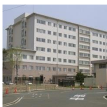
③ 小倉医療センター