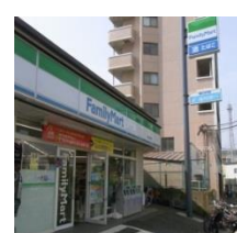
⑤ ファミリーマート